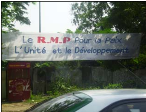
Les banderoles du R.m.p sont présentes dans toute la ville.

Les élections locales auront lieu, selon une décision gouvernementale, le 29 juin prochain. Par ailleurs, le ministre de l'administration du territoire et de la décentralisation, Raymond Mboulou, a publié, le 5 mai 2008, un arrêté fixant la date de clôture des candidatures aux élections locales, au 19 mai. En principe, selon la loi électorale, la campagne n'est ouverte que quinze jours avant le scrutin. Ce qui sous-entend que la campagne électorale pour les élections locales commencera le 16 juin prochain. Or, avant même cette date, le R.m.p (Rassemblement de la majorité présidentielle) semble s'être déjà lancé dans la course, par l'affichage de ses banderoles et la tenue d'une série de meetings publics.