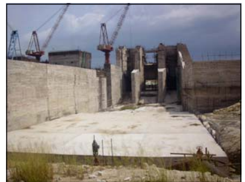
La partie de l'évacuation des eaux, pour assurer la sécurité du barrage et éviter son inondation.