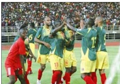
Les Maliens jubilent après avoir inscrit un but.

Pour ce qui est de cette première journée, vingt rencontres ont été disputées, trois autres reportées à une date ultérieure. Le Soudan et le Tchad ne sont pas descendus sur la pelouse. Pour la simple raison que les Tchadiens n'ont pas voulu se déplacer à Khartoum, prétextant que leur sécurité ne serait pas assurée là-bas. On sait que les relations entre les deux pays ne sont pas au beau fixe. Sur l'ensemble des rencontres, excepté le Burkina Faso, qui a créé la sensation, en s'imposant en Tunisie (2-1), face aux Aigles de Carthage, la plupart des équipes visiteuses ont perdu. C'est entre autres le cas des Diables-Rouges du Congo, en déplacement à Bamako, disions-