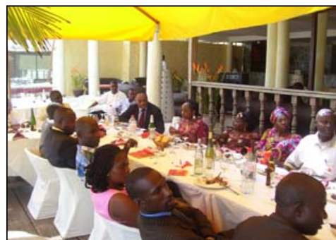
Une vue du déjeuner offert à cette occasion.

tenaires incontournables et mènent des actions importantes. Sans ces derniers à nos côtés, depuis le début de Celtel au Congo, l'impact de nos actions n'aurait pas la même aura», s'est exprimé le Directeur Général de Celtel qui nous rassure faire la même démarche à Brazzaville.