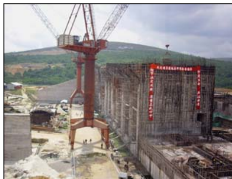
Le barrage d'Imboulou en construction.

d'une indemnité pour les fonctionnaires affectés à l'intérieur du pays, notamment dans le Pool où la situation sécuritaire n'était pas totalement garantie. Les chefs de quartier, quant à eux, ont manifesté leur satisfaction à l'opération de déguerpissement des bouchons sur la route nationale n°1. Ils ont félicité le gouvernement et souhaité que celui-