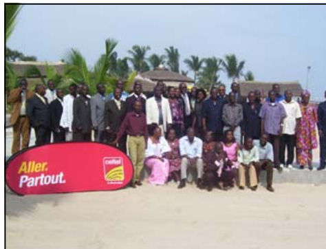
Photo de famille des membres du Club Média de Pointe-Noire.

Le Club Médias a pour objectif de promouvoir les valeurs et règles du métier de journalisme, promouvoir les valeurs et les missions de Celtel, favoriser les échanges et le partage d'informations sur les avancées technologiques dans les domaines des NTIC, favoriser l'utilisation des NTIC dans les medias. Le Club Médias est également compris comme un cadre de travail permettant d'accompagner les professionnels des medias dans leurs missions. Devant cette opportunité, les professionnels de la communication ont déclaré, à la fin de la cérémonie qu'un mariage de cœur et de raison était, désormais scellé avec Celtel et,