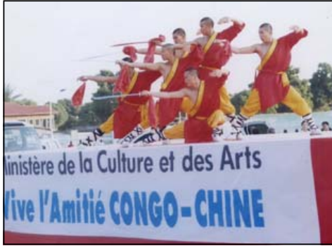
Une vue du spectacle à Nkombo.

paut, représentant son collègue Jean-Claude Gakosso; de l'ambassadeur de Chine au