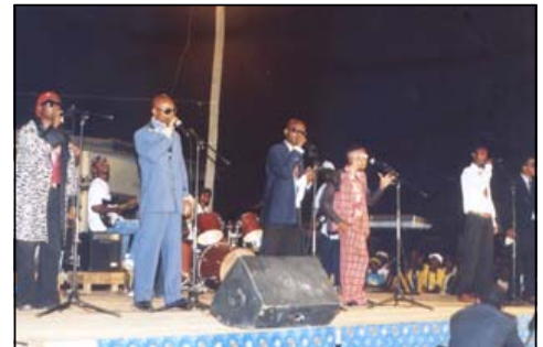
L'orchestre Dolisiana rive gauche.