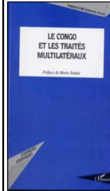
La couverture du livre.