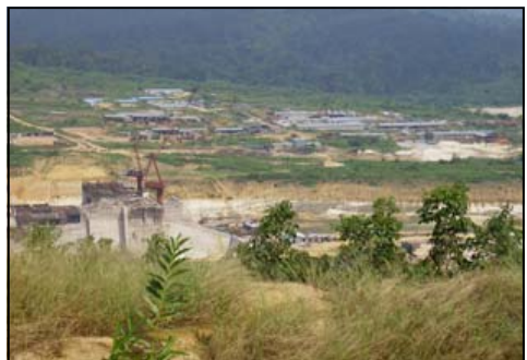
Le site du barrage à Imboulou.