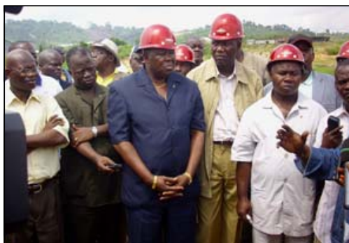
La délégation des députés au barrage d'Imboulou.

Les députés de la majorité émerveillés par le chantier du barrage d'Imboulou