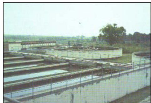
Une vue de l'usine de traitement d'eau de Djiri.