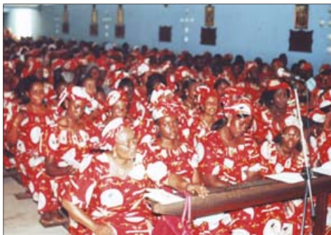
Une vue des membres de la Fraternité Sainte Monique, pendant la messe.