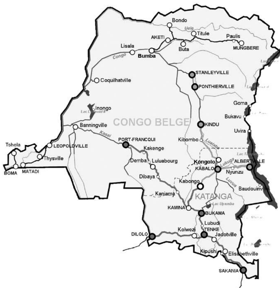
KAART 1: BELGISCH CONGO, SPOORWEGENNET AAN HET BEGIN VAN DE JAREN 1930 14