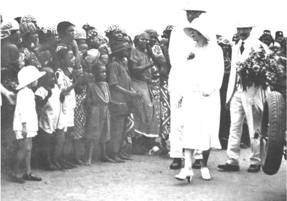
FOTO 6: BEZOEK AAN HET MILITAIRE KAMP VAN LÉOPOLDVILLE. FAMILIELEDEN VAN DE MILITAIRES 86

Het Congoreisdagboek van koning Albert werpt een duidelijk licht op de positie van de vorst in deze problematiek. Zijn reiservaring in de zomer van 1928 droeg er ongetwijfeld toe bij dat Albert zich meer dan voordien bewust was van de sociale gevolgen van de versnelde ontsluiting van de kolonie. Reeds voor de Congoreis, maar nog opvallender erna kan het Paleis tot het kamp van de sociale hervormers inzake koloniale politiek gerekend worden – zo er binnen het doorgaans hechte koloniale establishment al van "kampen" sprake kan zijn natuurlijk. Daarbij werd een grote rol toebedacht aan de ontwikkeling van de inheemse landbouw als een alternatief voor de voortschrijdende proletarisatie veroorzaakt door de Europese ondernemingen. In de rede die koning Albert bij zijn terugkeer in Brussel uitsprak, schoof hij de verbetering van de levensomstandigheden van de inheemse bevolking naar voor als een politieke prioriteit. De Britse ambassade in Brussel meldde aan