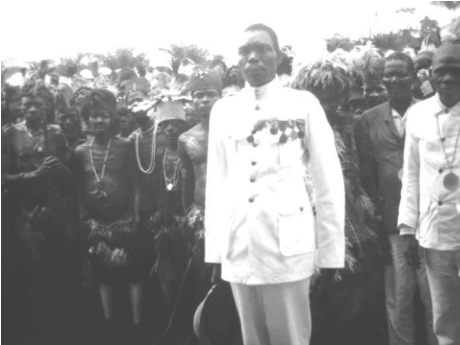
FOTO 4: "LE CHEF VIENT NOUS SALUER; C'EST UN BEAU NÈGRE BALUBA, HABILLÉ EN EUROPÉEN AVEC UN CASQUE BLANC; DOMMAGE" 37