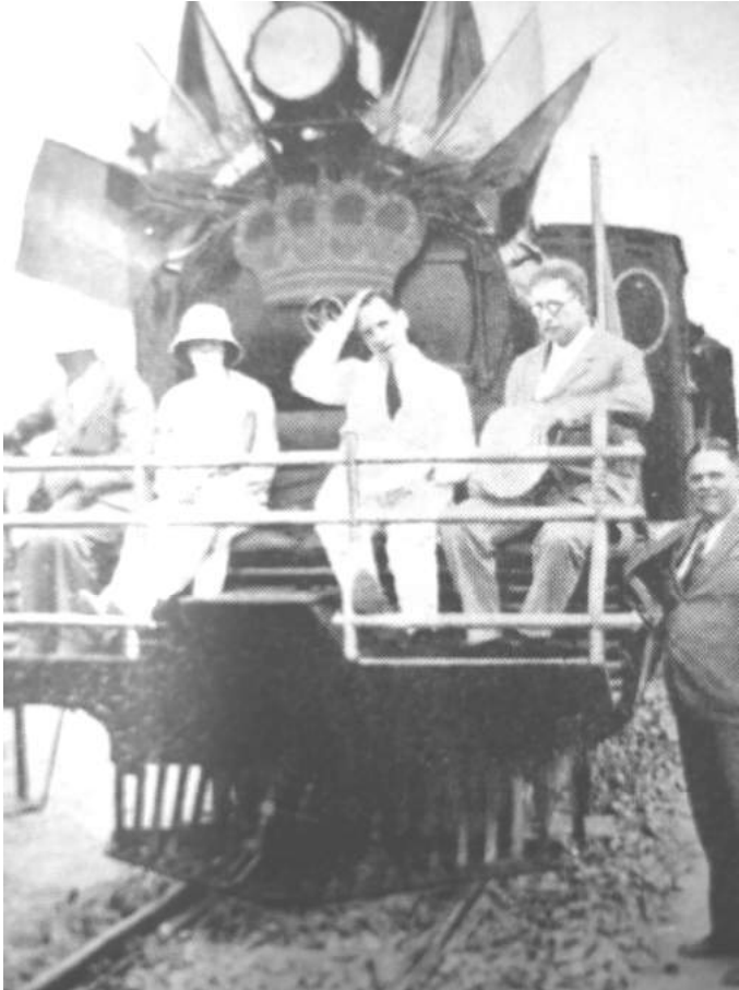
FOTO 3: DE GROTE AFSTANDEN TIJDENS DE VORSTELIJKE CONGOREIS WERDEN OVERBRUGD PER VLIETUIG, TREIN OF RIVIERBOOT. 30