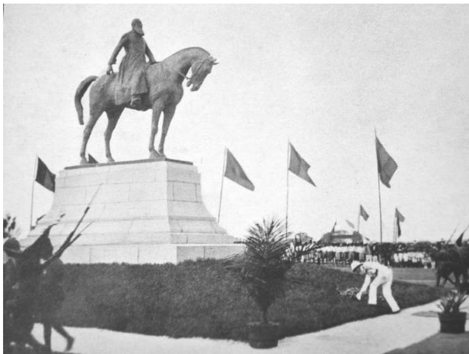
FOTO 1: "LE ROI DÉPOSANT UNE COURONNE AU PIED DE LA STATUE DE LÉOPOLD II QU'IL VIENT D'INAUGURER", LÉOPOLDVILLE 5

Op 21 juni 1928 liep de "Thysville" de haven van Boma binnen. Koning Albert was aangenaam verrast door het enthousiaste onthaal dat het vorstenpaar te beurt viel, ook en vooral vanwege de massaal aanwezige zwarten. Boma was het oudste Europese centrum in Congo en van 1886 tot 1926 de hoofdstad – eerst van de Vrijstaat en nadien van de kolonie. Na een bezoek aan de haveninstallaties en een excursie in het omliggende gewest, ging het per vliegtuig naar Thysville, 240 km landinwaarts, en vandaar, na een bezoek