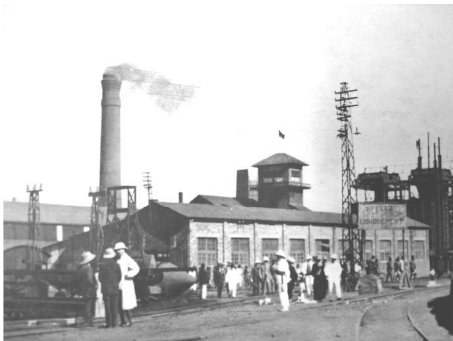
FOTO 5: "VISITE DES USINES DE PANDA (UNION MINIÈRE DU HAUT-KATANGA)" 55

schappijen, zoals Forminière en UMHK, die het actiefst wierven, zich op dit vlak benadeeld door het free-ridergedrag van de kleinere ondernemingen. Vermits de meeste arbeidscontracten een korte looptijd kenden (doorgaans van 6 maanden tot maximaal drie jaar), konden de kleinere ondernemingen vele arbeiders na afloop van hun eerste contract weglokken met marginaal hogere lonen, zonder in de aanvankelijke rekruteringskosten te moeten delen. De wens om dit "gebrek aan fair-play" het hoofd te bieden en de noodzaak om de schaarse arbeidskracht sterker aan zich te binden – zonder evenwel af te stappen van de politiek van lage lonen – brachten de UMHK en Forminière ertoe hun aanpak van de arbeidsproblematiek grondig bij te stellen. Vanaf de tweede helft van de jaren 1920 maakten deze ondernemingen ernstig werk van een verbetering van de sociale voorzieningen met het doel een stabiel personeelsbestand op te bouwen. "Stabilisation de la main-d'œuvre" werd het nieuwe slagwoord.