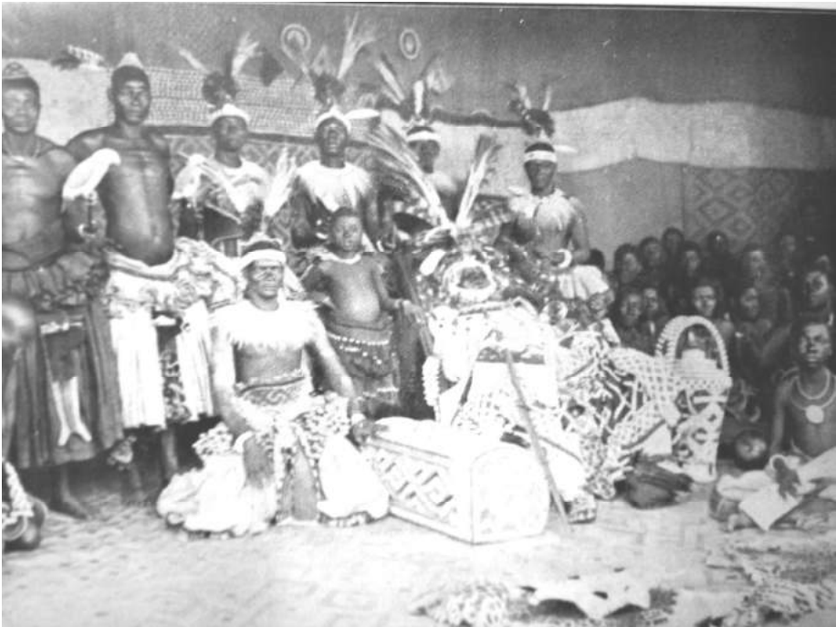
FOTO 2: "LE ROI LUKENGO AVEC SES MINISTRES ET SES TROIS CENTS FEMMES" 19

Op 11 juli deed het vorstenpaar zijn intrede in Elisabethville. De nog jonge, zich snel ontwikkelende stad maakte een gemengde indruk op de koning: