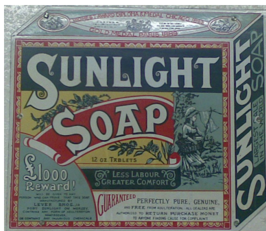
Zeep van 'Lever Brothers', nu de multinational 'Unilever'

Voordien produceerden mensen voedsel voor de eigen consumptie. Deze overlevingslandbouw werd vervangen door exportlandbouw : gronden werden in beslag genomen, plantages werden opgericht en de boeren werden verplicht om er te werken. Er werd niet enkel voedsel geproduceerd, maar ook andere landbouwproducten die bestemd waren voor de industrie zoals ..... (Lever Brothers maakte er zeep van) en ..... (Leopold II maakte er grote winsten mee in Congo).