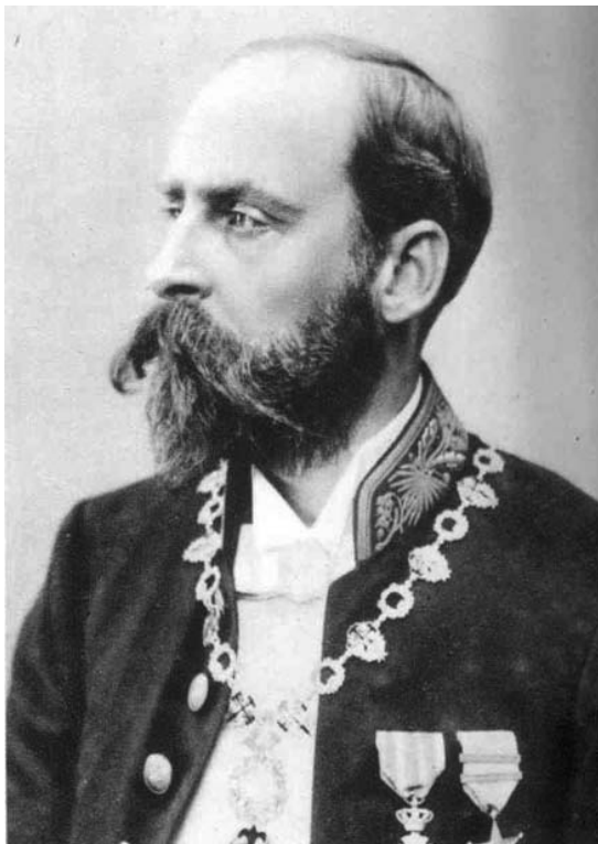
Gouverneur-generaal Félix Alexandre Fuchs.

ciale opdracht in Opper-Congo. In 1900, tijdens de conferentie in Londen in verband met de protectie van fauna in Afrika, vertegenwoordigde Fuchs Congo Vrijstaat. Twee jaar lang ondernam hij inspectietochten in grote delen van Congo, naar de grote meren en de Opper Nijl om via de Ubangi terug te keren. Op 28 november 1907 werd het verdrag getekend, waarbij België de Vrijstaat annexeerde. In 1910 werd de administratie hervormd naar Brits model. De Smet de Naeyer en De Faverau hadden Leopold II eindelijk overtuigd. In mei 1912 volgde Felix Fuchs, een jurist, Wahis op als gouverneur-generaal.