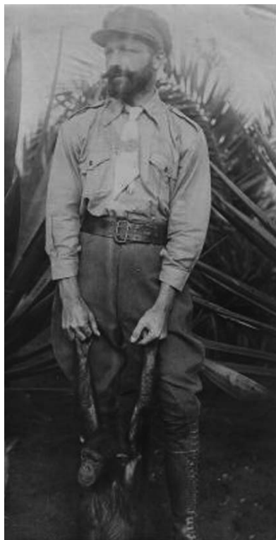
Officier FP met gevangen aapje.

In het najaar van 1914 kregen de Duitsers spijt over het openen van vijandelijkheden in Afrika en poogden alsnog het Belgische voorstel tot neutralisering van het Congobekken op te pikken; tevergeefs. 37 Stiénon wijst op de inbreuk op het internationaal recht toen Duitsland een inheemse troepenmacht, niet geleid door blanke officieren maar door traditionele chefs, toestond het Belgisch garnizoen aan te vallen in het hartje van het