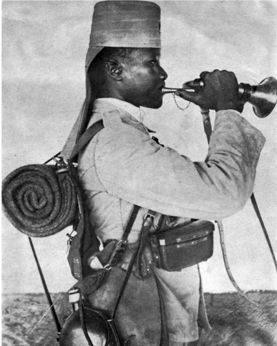
Askari-hoornblazer uit Duits Oost-Afrika.