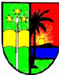
Faculteit Wetenschappen Universiteit van Kisangani