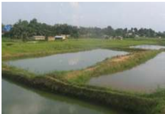
Aanleren en vulgariseren van visteelt; verdeling van pootvis aan vistelers.