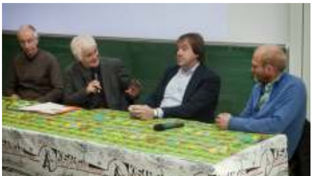
Het wetenschappelijke debat