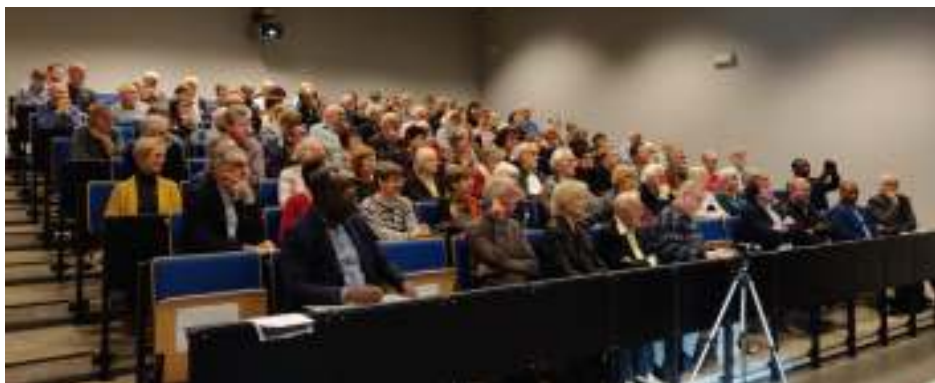
126 deelnemers aan “20 jaar Kisangani vzw”

vzw: “In de jaren tachtig kon ik als hoogleraar en later als decaan van de Faculteit Wetenschappen van de Universiteit van Kisangani, een goed team uitbouwen. Met deze groep enthousiaste professoren en assistenten heb ik in de jaren 90 de eerste projecten opgezet. Congo zakte toen zo snel weg dat we de ondervoeding bij kinderen dagelijks zagen toenemen. We vonden het onze plicht om de nodige initiatieven te nemen. Vanaf 1999 hebben we de werking in een vzw ondergebracht. Hierdoor konden we verder groeien en de nodige continu-