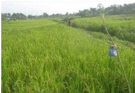
Aanleren van natte rijst kweken in drassige gronden en het leveren van zaden aan de rijstkwekers.