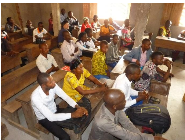
Personeelsvergadering tijdens ons verblijf

Mukumadi voerde campagne onder de slogans 'Pour l'unité et le développement du Sankuru' en 'Faire du Sankuru une école'. Mogen we onder dit laatste verstaan dat onderwijs een prioriteit in zijn beleid zal zijn?