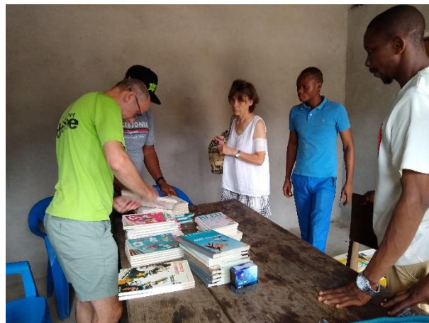
Boeken uitpakken voor de bibliotheek