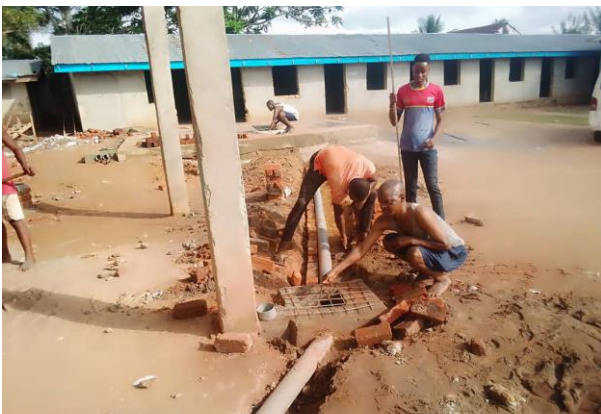
Werken aan de waterleiding

Ook in de provincie Sankuru – met Lodja als belangrijke stad – lijkt er een einde te komen aan de institutionele crisis die al aansleept sinds juli 2019. Tussen het provinciale parlement en de nieuw verkozen gouverneur Joseph Stéphane Mukumadi was een krachtmeting aan de gang die echt bestuur onmogelijk maakte. Op 19 mei 2021 evenwel werd een nieuwe provinciale regering geïnstalleerd met ministers die alle zes regio's van de provincie vertegenwoordigen. Ook in de provincie Sankuru is er vandaag, na een valse start, hoop op verandering ... Onlangs bracht gouverneur Mukumadi een bezoek aan het Complexe Scolaire in Lodja.