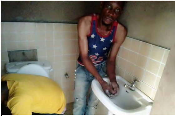
Laatste afwerking aan de toiletten