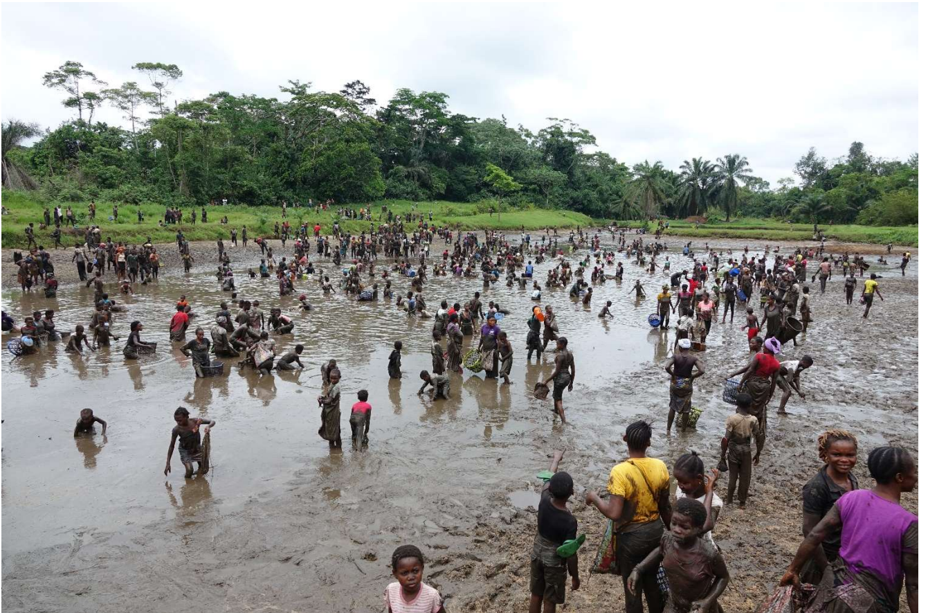
De 'vidange' in Ngene Ngene, na de eerste vangst door het team mogen de omwonenden 'navissen'