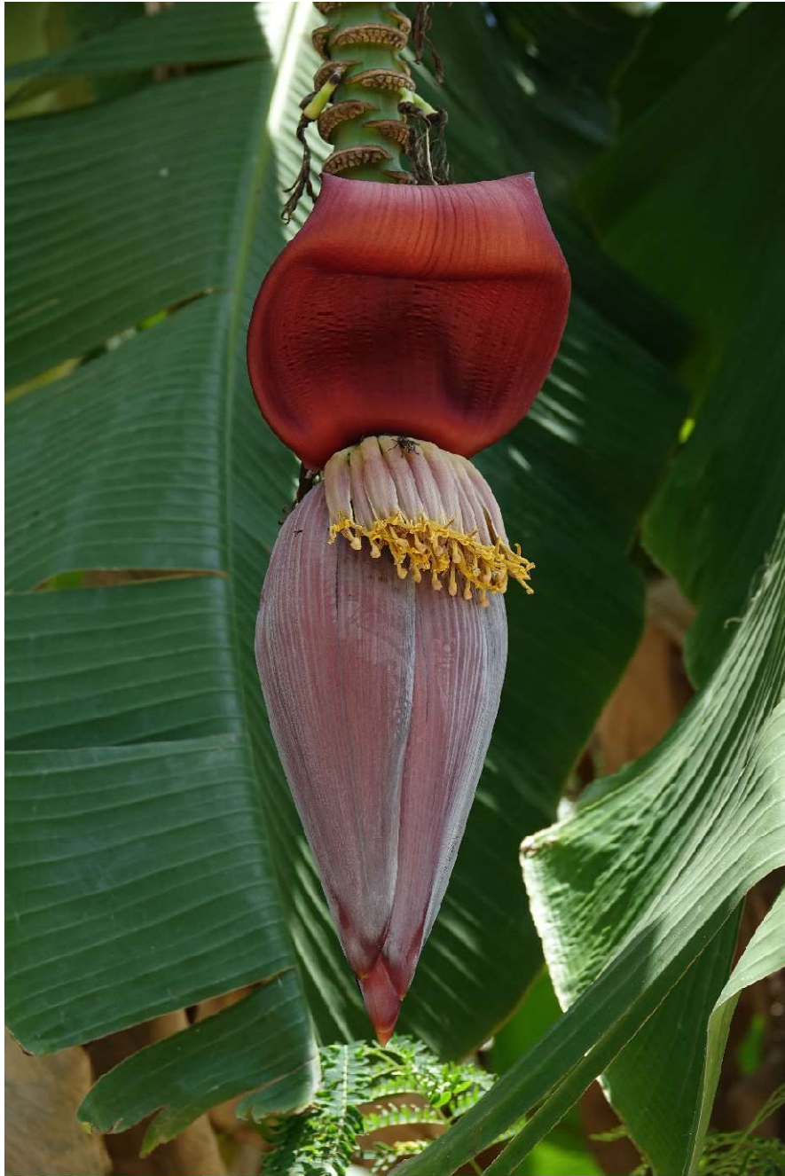
Een bananenplant in bloei