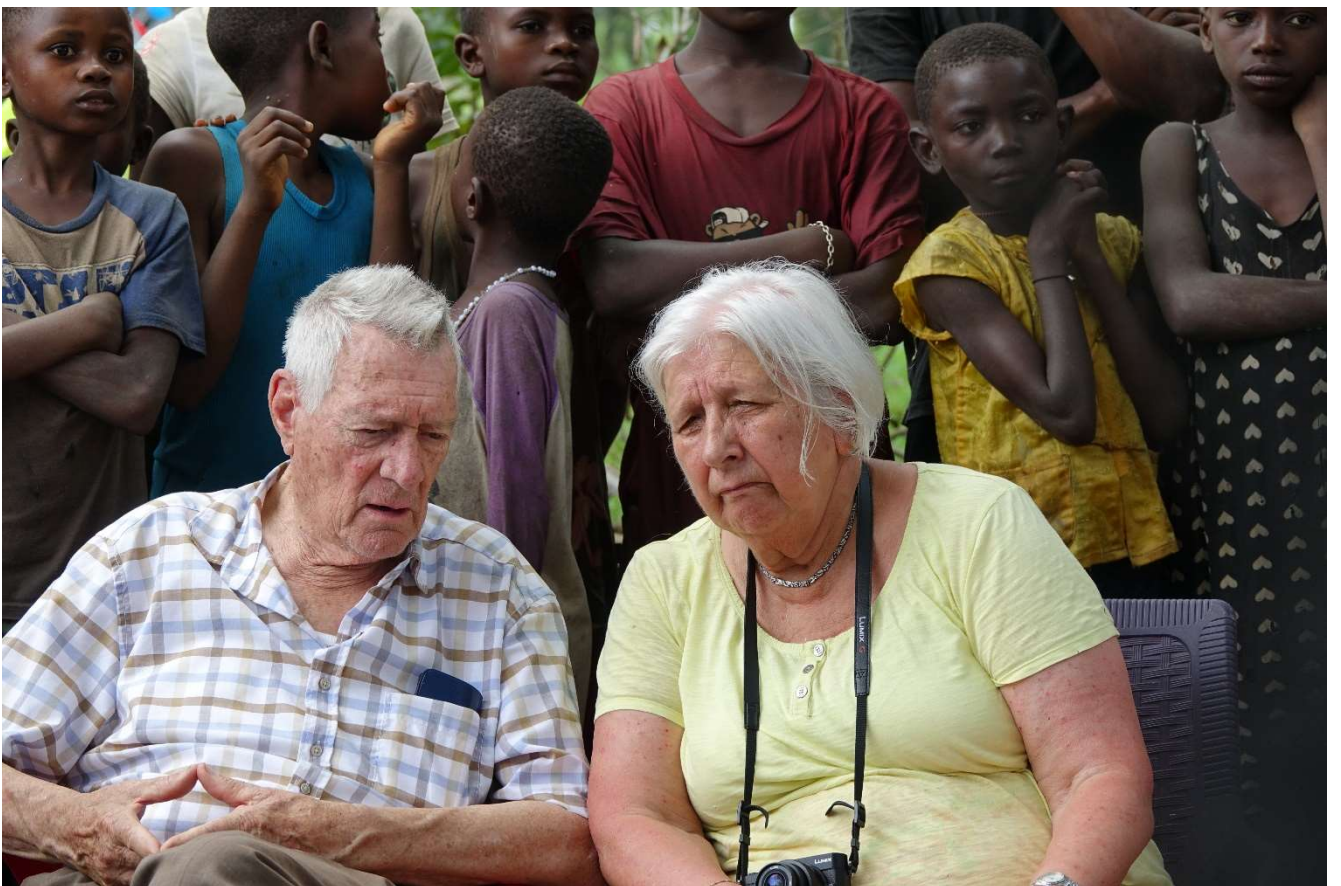
Le roi et la reine 😊