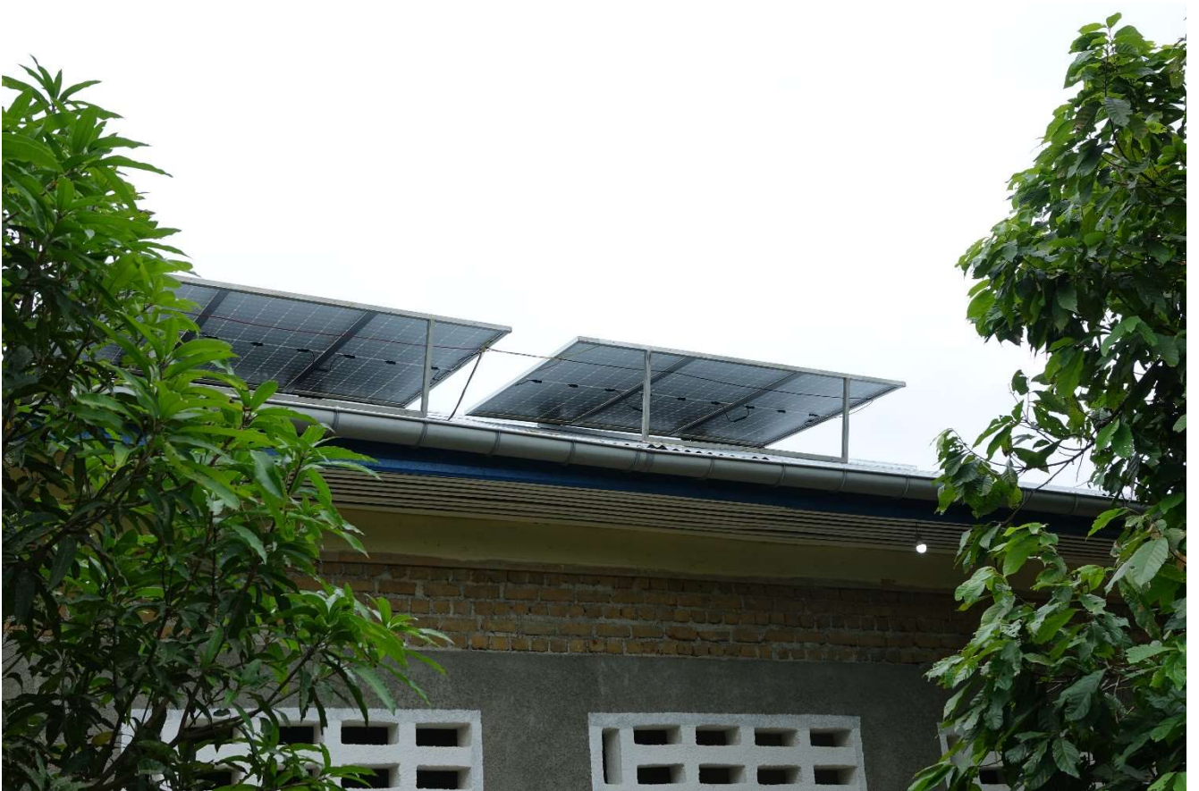
De nieuwe zonnepanelen op Masako