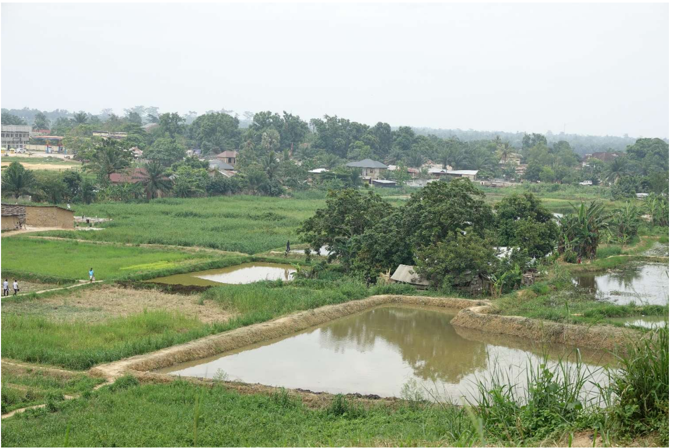
De site van Djubu Djubu