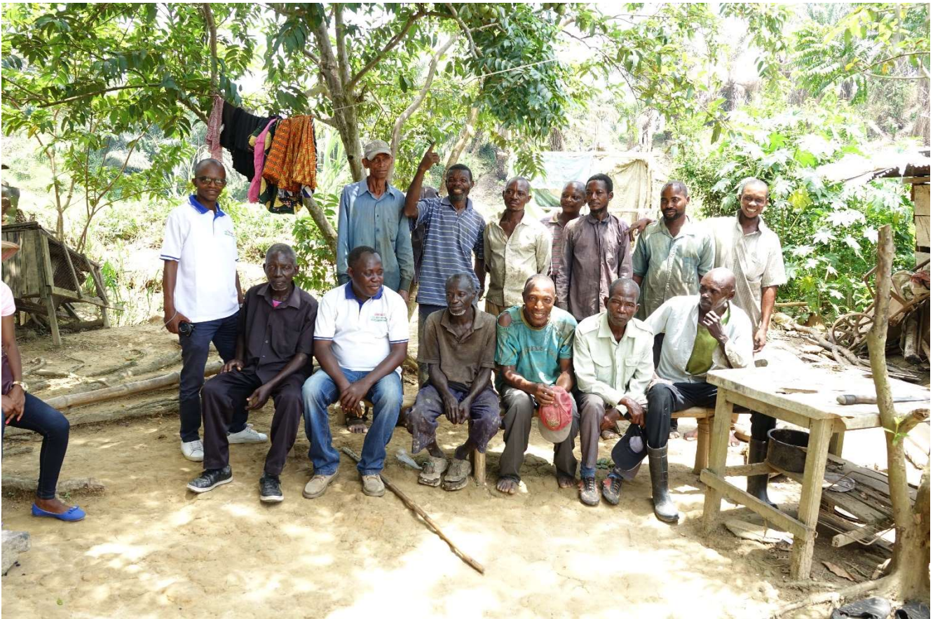
Het team van Djubu Djubu