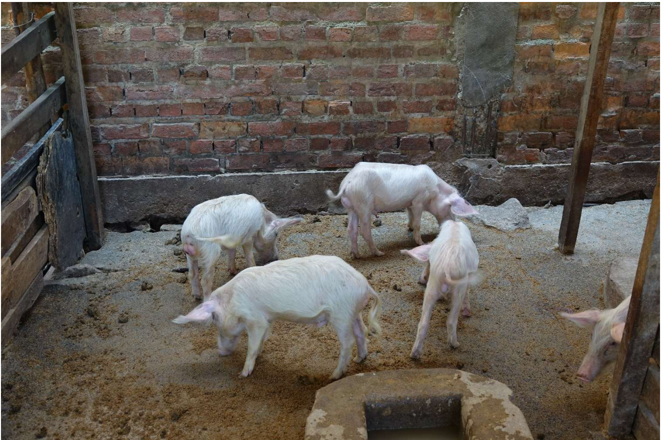
Enkele varkens in de stallen op de faculteit