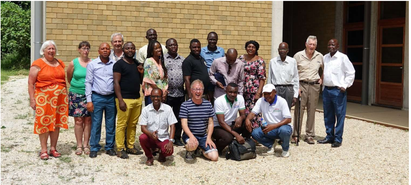
Na de teamvergadering nog even allemaal samen op de foto