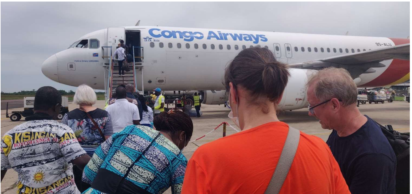
En terug naar huis