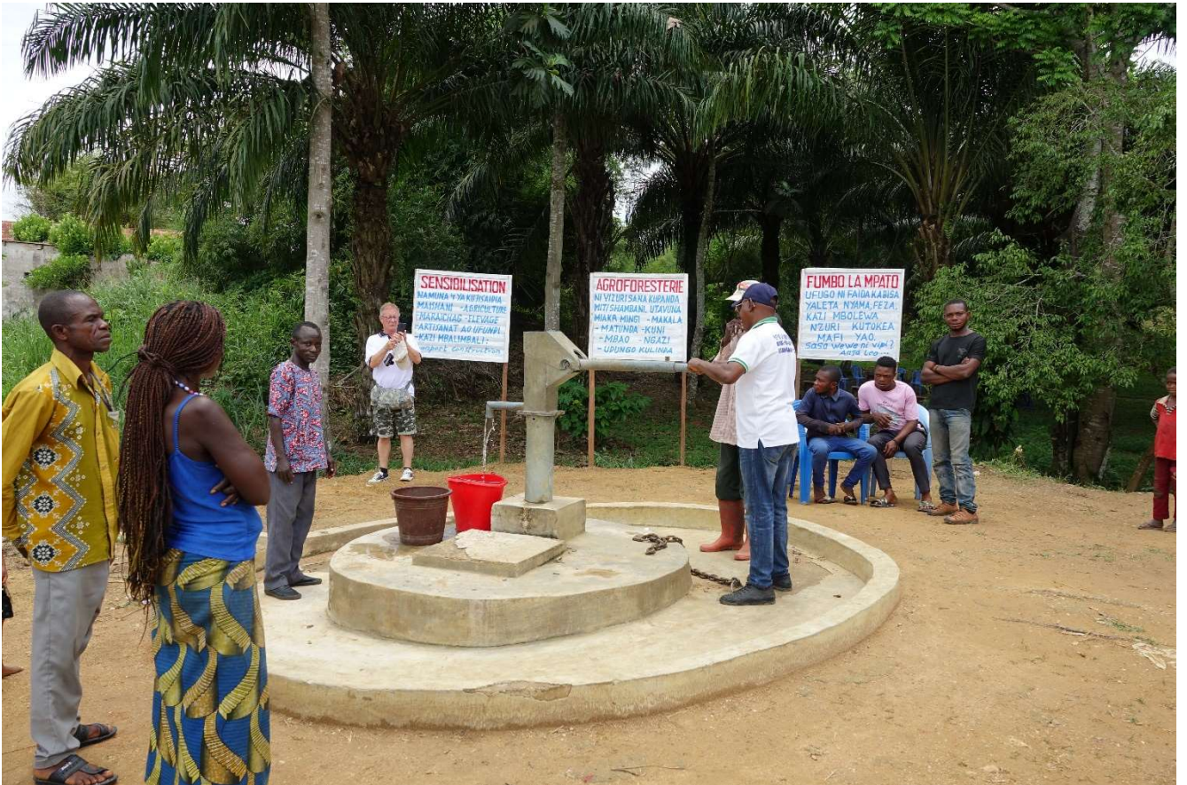
De waterpomp in Batiamaduka