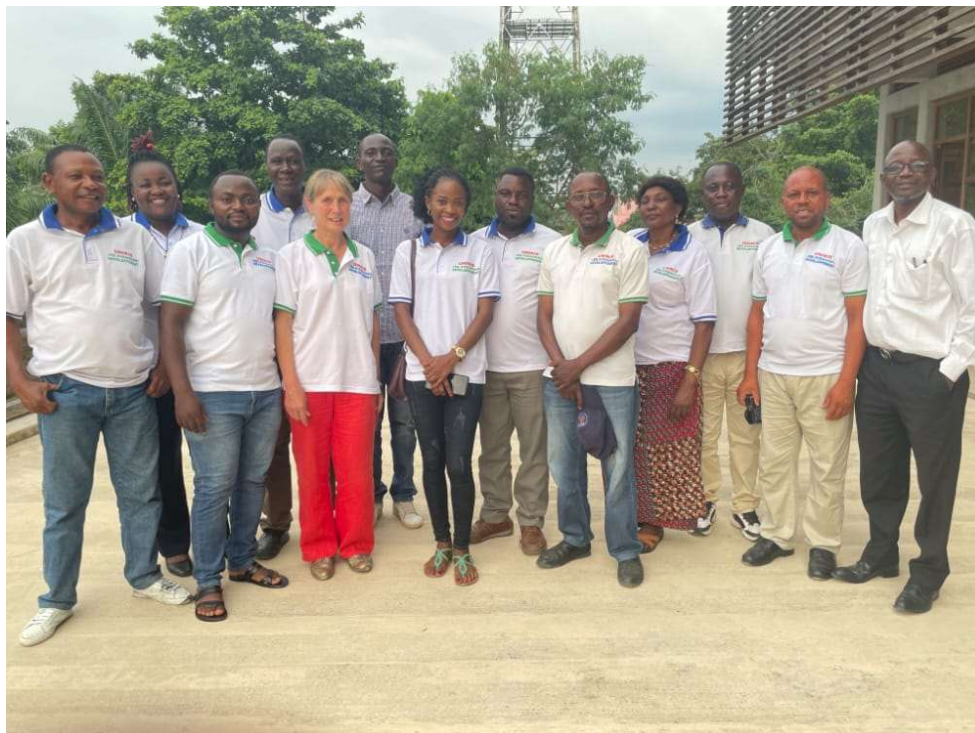
Het team in Kisangani