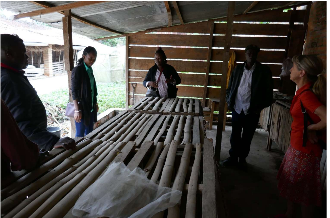
Bij de konijnen op de faculteit.