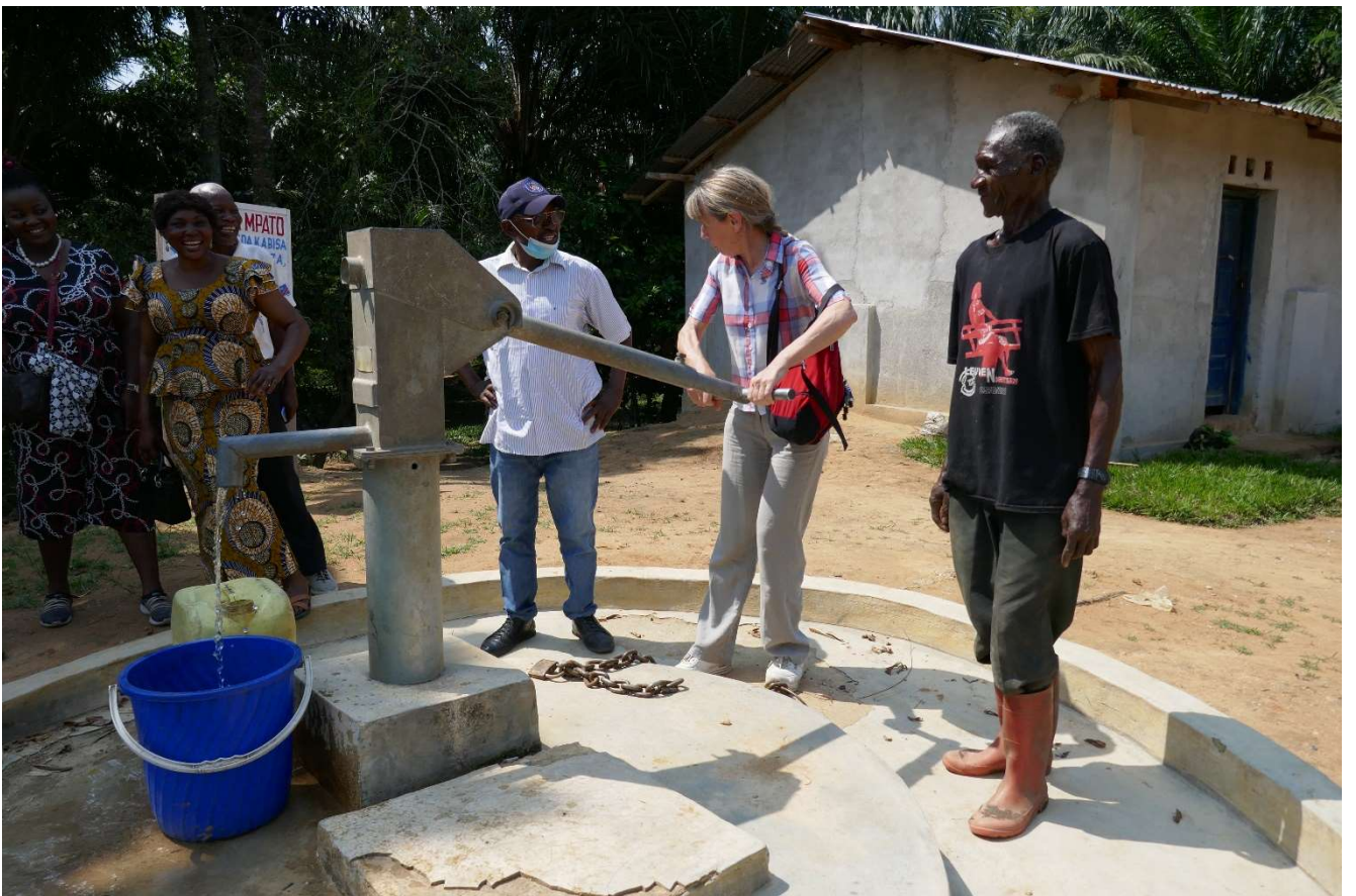
De waterpomp in Batiamaduka