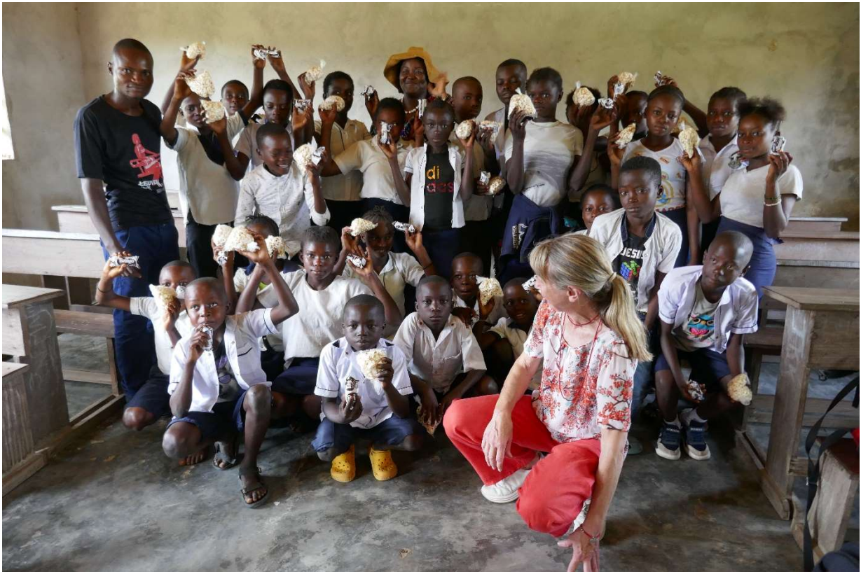
Met schoolkinderen van de school van het eiland Mbiye.